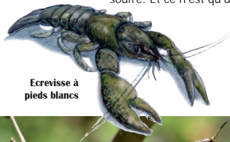
Ecrevisse à pieds blancs